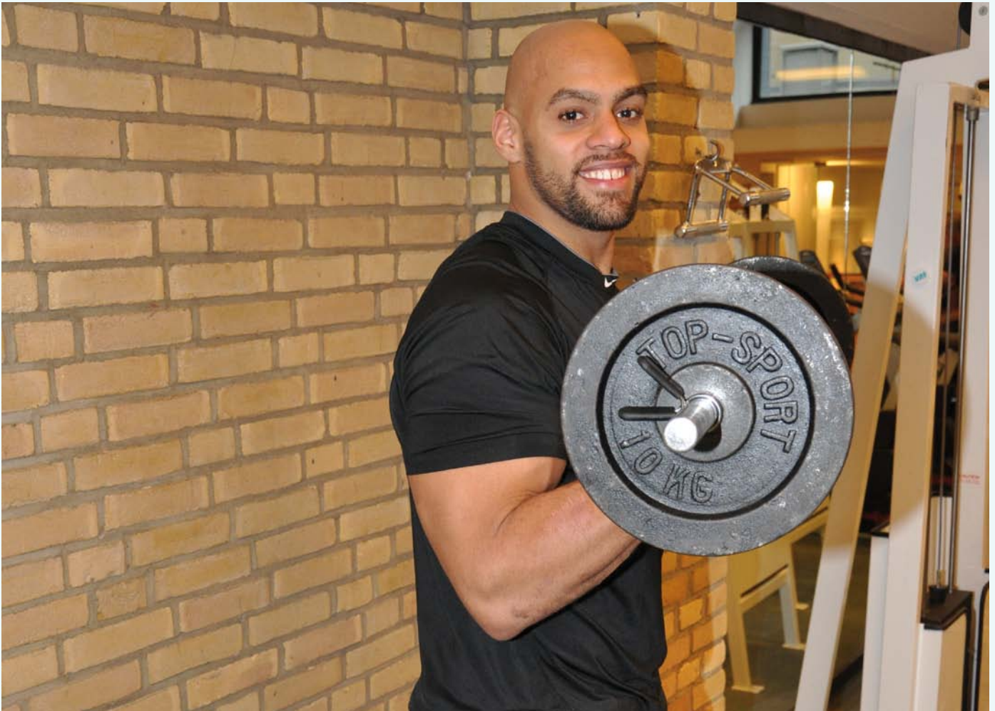
NFL-Profi Kasim Edebali von den New Orleans Saints hat während seines Heimaturlaubs wieder im Studio des VAF trainiert. Wir wünschen Kasim viel Erfolg für die nächste Saison!